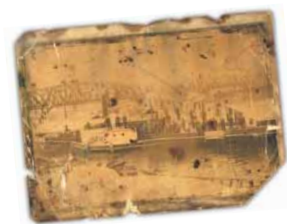
Foto in alto: Il rimorchiatore Milano (secolo scorso) a Pontelagoscuro durante la crociera Pavia-Venezia. Foto a lato: territorio di Mantova (stampa 1620).